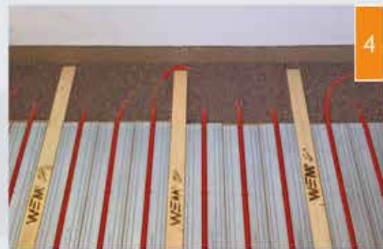
(4) Katke torupoognate piirkonnad puistematerjaliga.