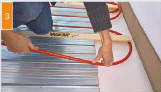
(3) Asetage soojust juhtivatele plaatidele toru ja ühendage kütteahela jaoturiga.