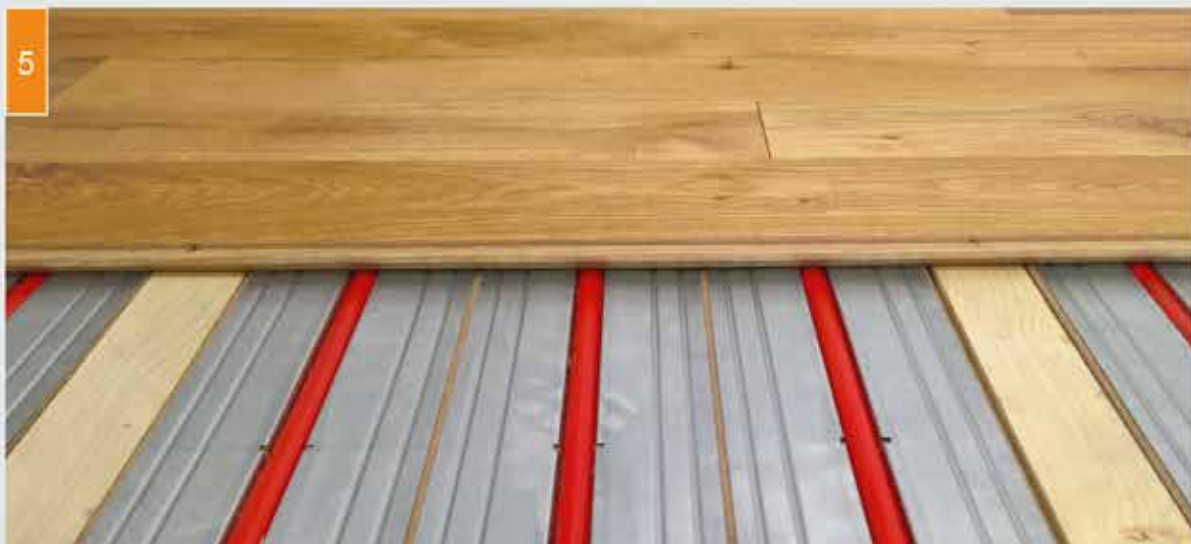
(5) Paigaldage põrandakate (selles näites põrandalauad).

Üksikasjaliku paigaldusjuhendi leiate meie veebilehelt www.wandheizung.de (vt tagaküljel QR-koodi).