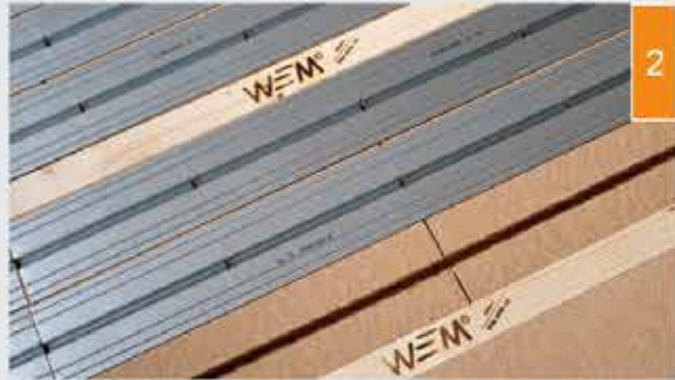
(2) Pange paigaldusplaatidele soojust juhtivad plaadid.