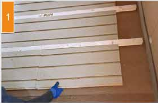
(1) Paigutage puitkiud-paigaldusplaadid ja profilliistud oma kohale.